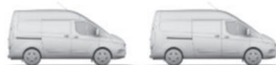
L1 H2 7,2 m³