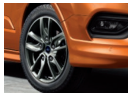
Jantes alliage 18" sur pneumatiques 235/50R18 (De série sur Fourgon Sport 290)