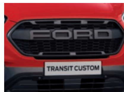
Calandre exclusive noire F O R D (De série)

Modèle présenté : Ford Transit Custom Trail L1 H1 en peinture non métallisée Rouge Racing (De série).