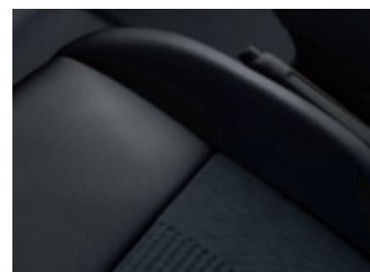
Garnissage cuir/tissu Bleu Storm Active (De série)