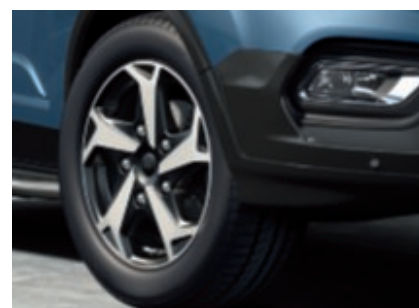
Jantes alliage 17" 5 branches Active (De série)