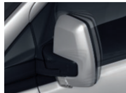
Rétroviseurs extérieurs rabattables électriquement (De série)

Modèle présenté : Ford Transit Custom finition Limited L1 H1 en peinture métallisée Gris Magnetic (option).