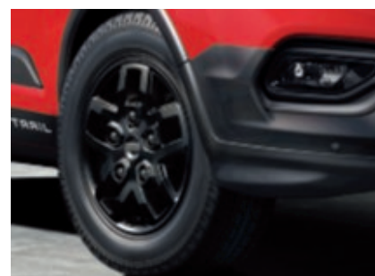
Jantes alliage exclusives 16" 10 branches (De série)