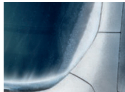
Pare-brise chauffant Quickclear (De série)