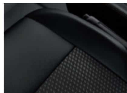
Sellerie cuir*/tissu (De série)