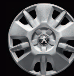
Enjoliveur 15" sur version Légère