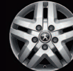
Jantes alliage 16" sur version Lourde