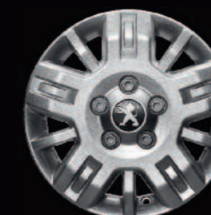
Jantes alliage 15" sur version Légère