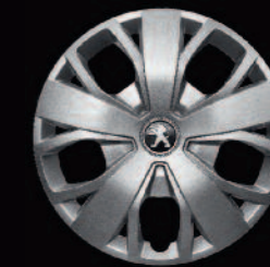
Enjoliveur 16" sur version Lourde