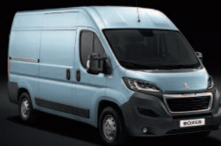
Bleu Lago Azzuro